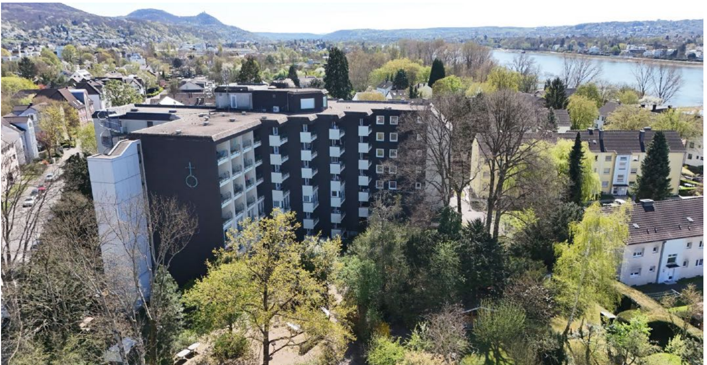
Das Seniorenzentrum Theresienau in Oberkassel liegt zwischen Rhein und Siebengebirge.

Außerdem erfordert die Pflege eine hohe Flexibilität von allen Mitarbeitenden. Wenn jemand ausfällt vor einem Wochenende oder Feiertag, muss jemand einspringen. Sie können die Bewohner:innen oder Kund:innen ja nicht unversorgt lassen, auch nicht an Heiligabend oder einem anderen Feiertag.