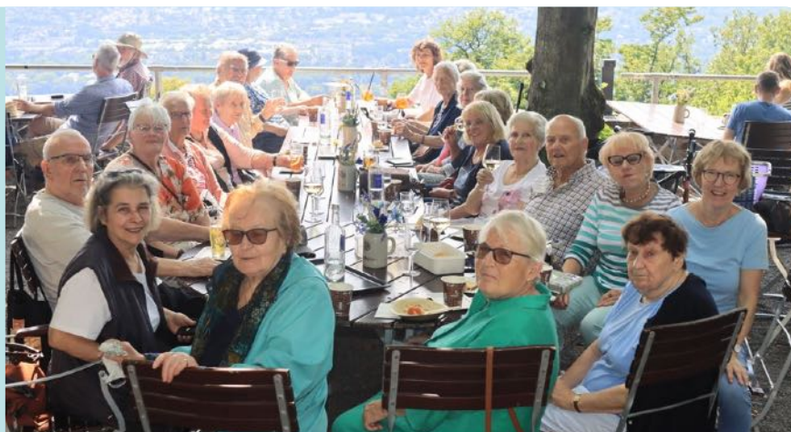
Ausflug auf den Petersberg

In unserer Gemeinde gibt es speziell für Senioren mehrere Angebote, auch für Männer. Jede Woche bzw. monatlich gibt es interessante Themen und es wird Gemeinschaft gelebt. Bei Interesse – schauen Sie doch einfach einmal vorbei: Gegen Vereinsamung, für Gemeinschaft und neue Impulse!