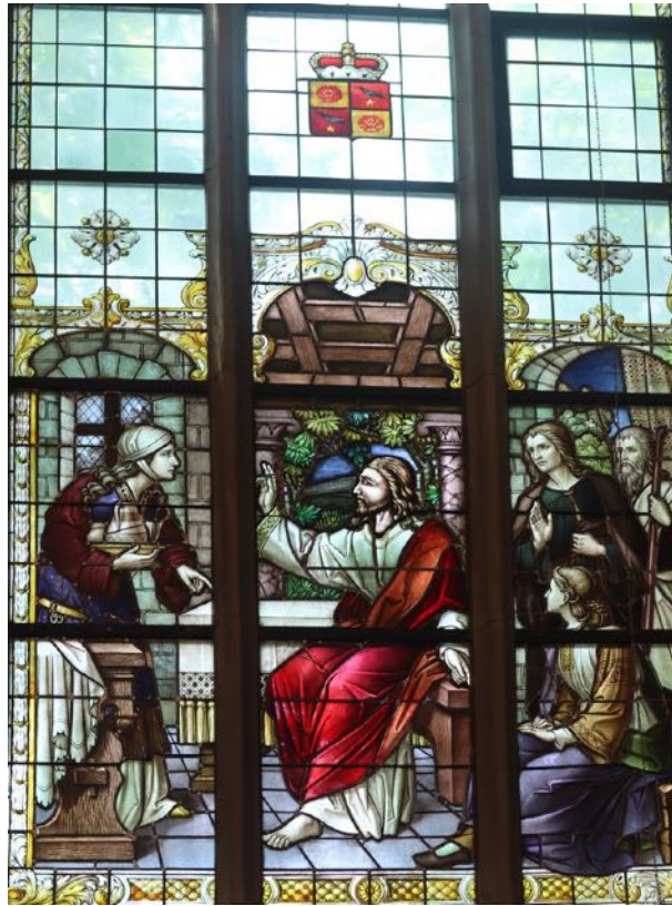
Motivfenster aus der Großen Kirche (Jesus mit Maria (rechts, hörend) und Martha in Bethanien)

Doch wer den Schritt hinein wagt, wer sich auf den Glauben einlässt, entdeckt etwas ganz anderes: Schönheit, Sinn und Licht. Von innen heraus zeigt sich die Tiefe, Wärme und Lebendigkeit der göttlichen Wahrheit – wie das Licht, das durch ein farbiges Fenster fällt.