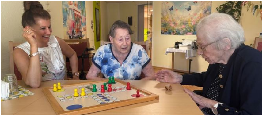
Heute wird gespielt und gelacht...

Bei den Menschen, die aus dem Ausland kommen, sind viele muslimischen Glaubens. Sie legen aber oft großen Wert darauf, die Bewohner:innen zu evangelischen Gottesdiensten oder zur katholischen Messe zu bringen. Und sie sind Weihnachten hier und feiern ganz selbstverständlich mit den Bewohner:innen.