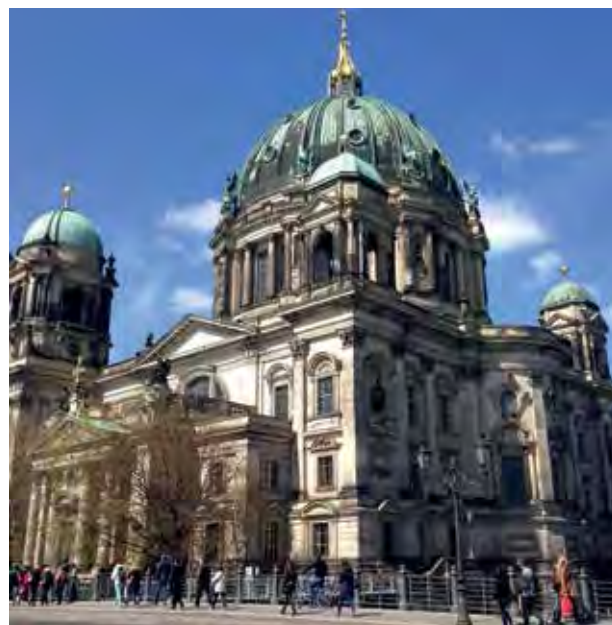
Ev. Dom, Berlin